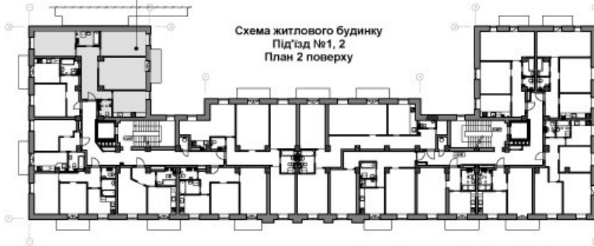
Схема житлового будинку Під'їзд №1, 2 План 2 поверху