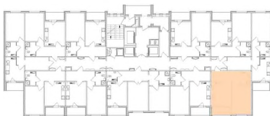
СХЕМА БУДИНКУ № 1 2-23 поверхи